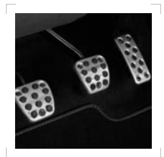
SPORTPEDALE IN ALUMINIUM