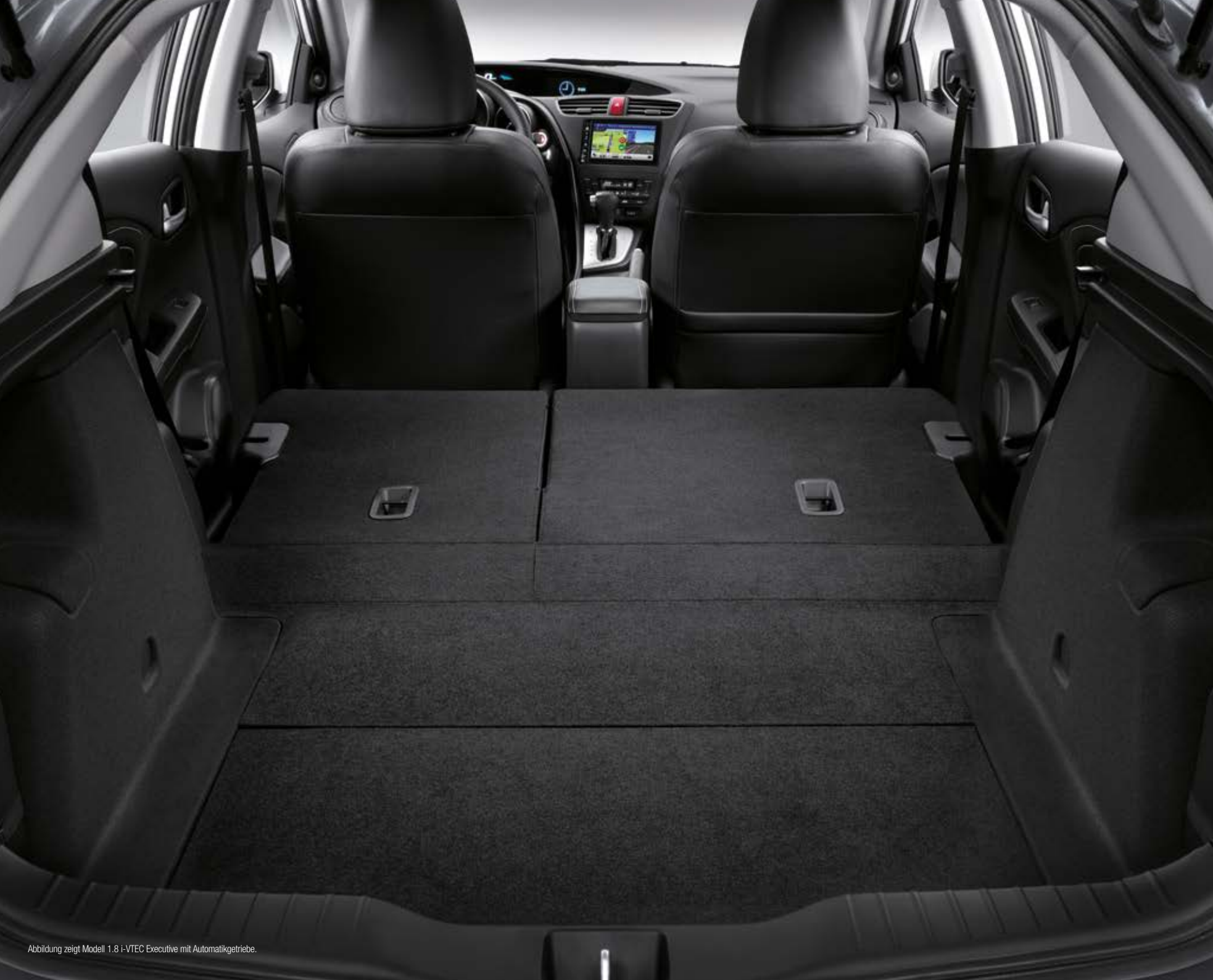
Abbildung zeigt Modell 1.8 i-VTEC Executive mit Automatikgetriebe.