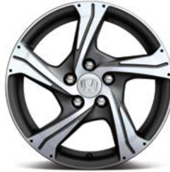
17- UND 18-ZOLL-FELGE ARGON