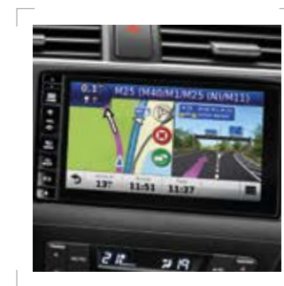
Honda CONNECT Navigation**