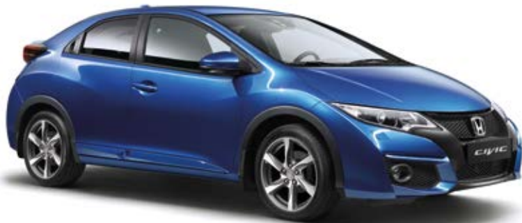
Abbildung zeigt 17-Zoll-Leichtmetallfelgen Cobalt

Wie Sie es von Honda erwarten können, wurde jedes Zubehörteil auf Sicherheit und Langlebigkeit konstruiert und getestet. Da das Zubehör gemeinsam mit dem Civic entwickelt wurde, können Sie sicher sein, dass jedes Teil dieselben hohen Qualitäts- und Zuverlässigkeitsstandards erfüllt. Alle Zubehörteile wurden genauestens an die Konturen des Civic angepasst. Alles ist maßgeschneidert und auf Ihre Bedürfnisse abgestimmt, denn bei Honda bekommen Sie nur das Beste vom Besten.