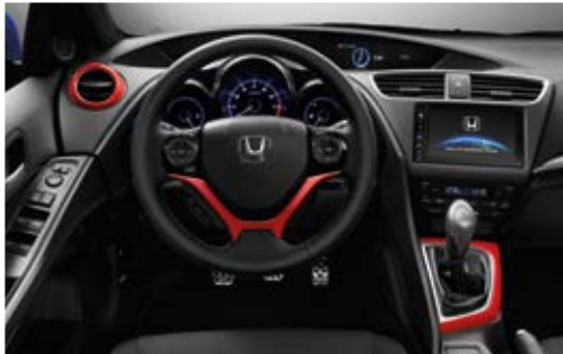
Abbildung zeigt Schaltknopf und Passform-Teppichsatz Elegance

Sorgen Sie im Innenraum mit dem Interieur-Paket in Rallye Red für ein ausgeprägtes Maß an Persönlichkeit. Dieses Paket stimmt die farblichen Akzente des Außendesigns auf den Innenraum ab und betont das sportliche Erscheinungsbild des Wagens.