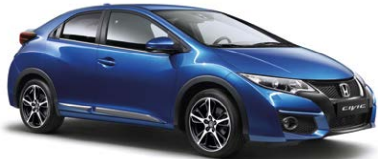
Abbildung zeigt 18-Zoll-Leichtmetallfelgen Hydrogen