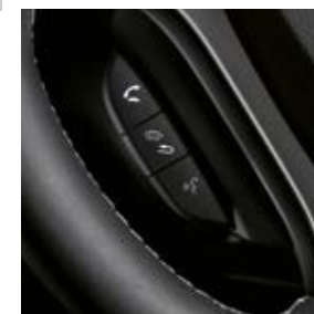
BLUETOOTH™-FREISPRECH- RICHTUNG MIT SPRACHSTEUERUNG*