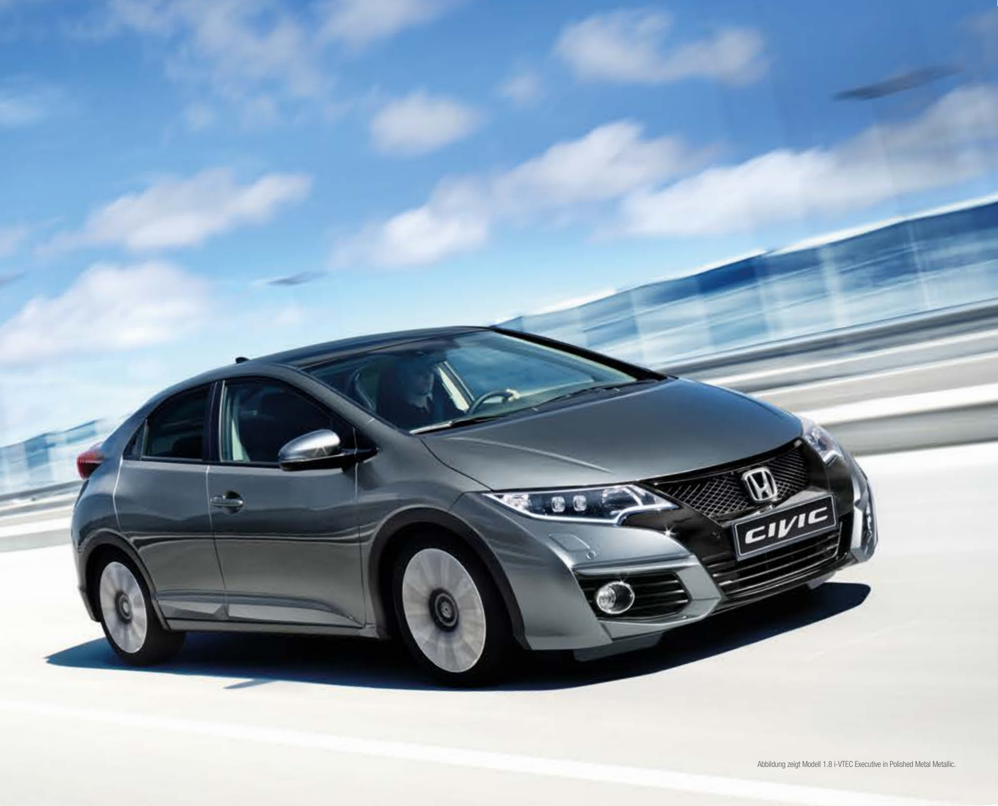
Abbildung zeigt Modell 1.8 i-VTEC Executive in Polished Metal Metallic.