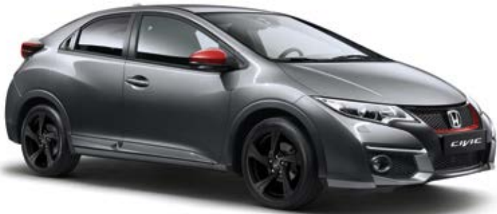
Abbildung zeigt 18-Zoll-Leichtmetallfelgen „Inferno“